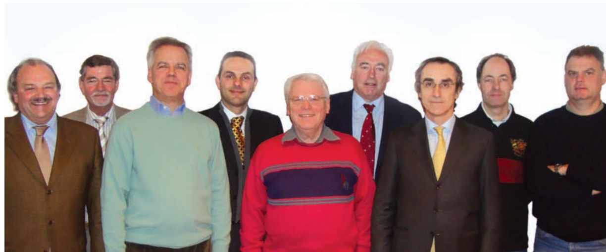
Il comitato di hotelleriesuisse Ticino:

SRI Group mette a disposizione di hotelleriesuisse Ticino il proprio personale e gli uffici, garantendo in questo modo una professionale segreteria, raggiungibile ogni giorno.