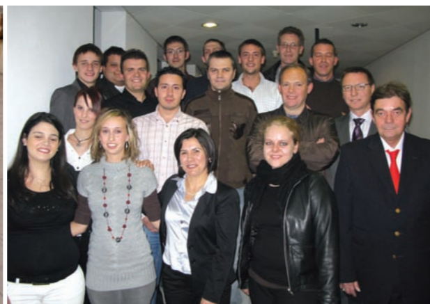
Gli apprendisti premiati

Nel 2009, abbiamo anche avviato una collaborazione in ambito formazione continua con GastroTicino. Una partnership che permette agli associati di accedere ai corsi di GastroTicino a condizioni di favore e che consente di incrementare la qualità del lavoro e le competenze dei collaboratori e dirigenti.