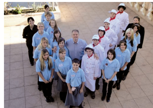
vivihotel 2009 a Lugano